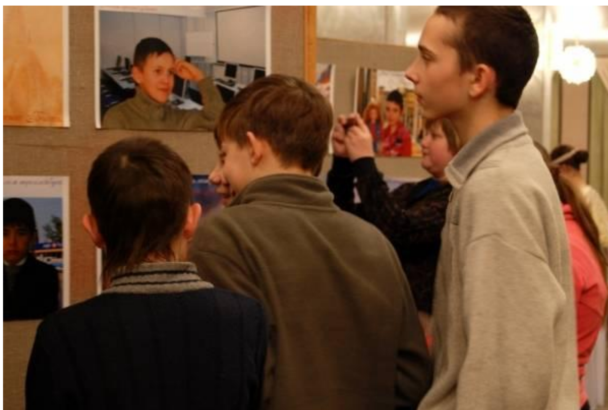
Фотовыставка «Просто Быть»

Второй год подряд ко Дню детей, больных раком крови, Областной Театр Драмы и наш фонд совместно организуют акцию «Они тоже мечтают». На сцене театра играл спектакль «Оскар и Розовая Дама» - о мальчике, болеющем раком (на основе произведения французского писателя Эрика-Эммануила Шмитта «Оскар и Розовая Дама»). А в фойе театра наш фонд организовал благотворительные мероприятия: фотовыставку «Просто Быть», беспроигрышную лотерею и мини-акцию «Наполни корзину прекрасными цветами». Во время благотворительных мероприятий всех зрителей радовал коллектив из ДШИ №6 пос. Светлого.