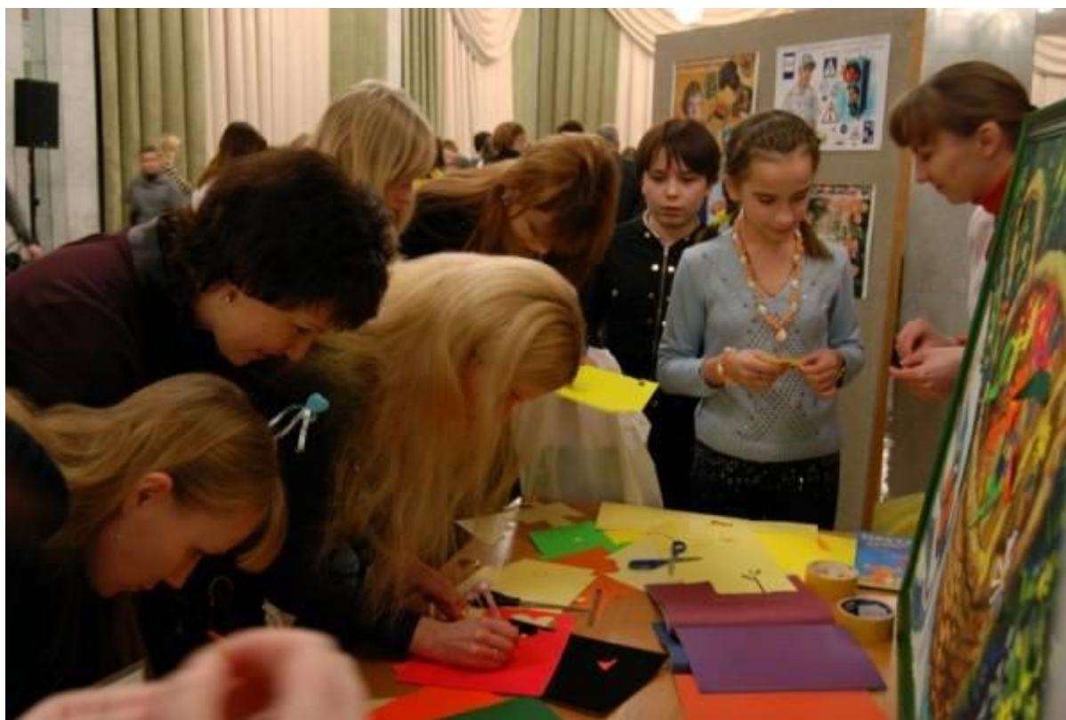
Мини-акция «Наполни корзину прекрасными цветами»

Детский благотворительный фонд им. Алены Петровой